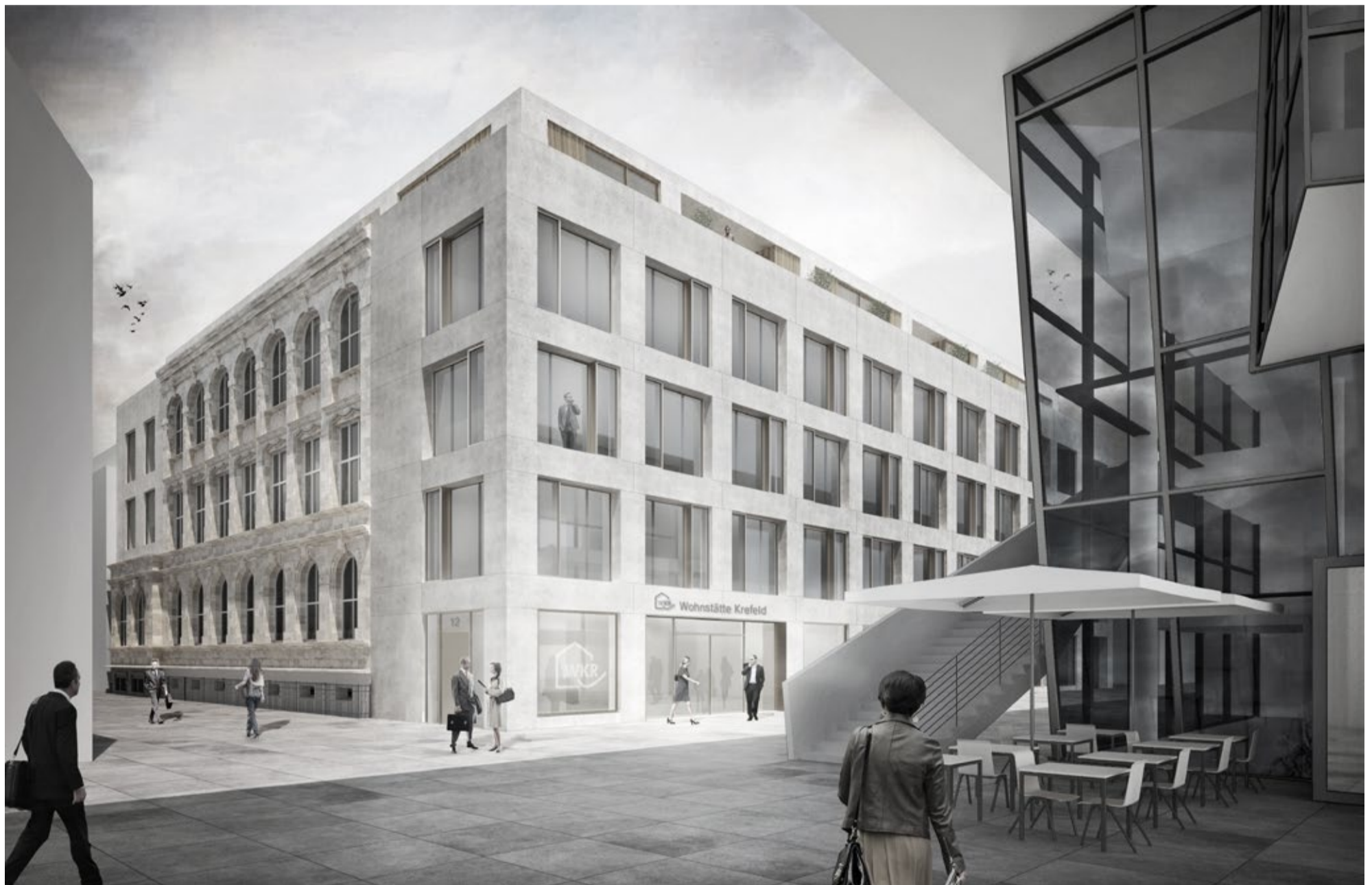
WKR Krefeld, Visualisierung von Blocher Blocher Partners WKR Krefeld, Visualisation of Blocher Blocher Partners

Die Fassadenarbeiten, immerhin rund 1.100 m 2 , werden in diesem Herbst ausgeführt. Die hohe Wertschätzung des Projekts zeigt sich nicht zuletzt in dem angestrebten Zertifizierungsprozess: der Auszeichnung in Gold durch die Deutsche Gesellschaft für Nachhaltiges Bauen (DGNB).