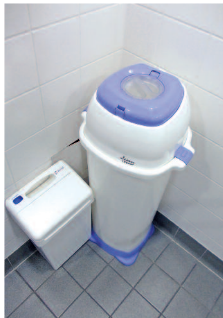
Entsprechende Abfallbehältnisse wie ein luftdicht abschließbarer Windeleimer gehören zur Ausstattung.