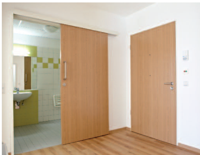
Wohnlich und barrierefrei – die Türen entsprechen den speziellen Ansprüchen an ein Pflegewohnheim.

die Innentüren erstrecken. Sowohl die Landesbauordnung zur Barrierefreiheit als auch die jeweiligen DIN-Normen zum Schall- und Brandschutz gilt es zu beachten. Um diesen Ansprüchen gerecht zu werden, kommen in den Carpe-diem-Häusern ausschließlich hochwertige Funk-