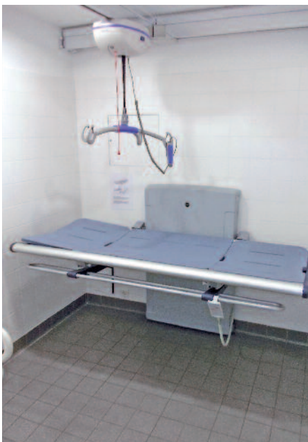
Höhenverstellbare Liege mit (hochklappbarem) Seitengitter, darüber der Deckenlifter

den WC-Anlagen bietet. Auch „Park & fresh“ für Park- und Rastplätze, „Shop & fresh“ für Einkaufszentren und „City &