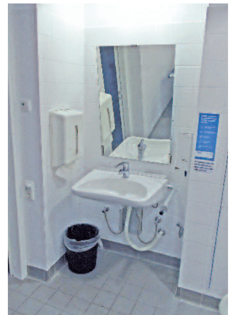
Unterfahrbar und in optimaler Griffhöhe: Waschbecken, Seifenspender und Papierhandtuchhalter