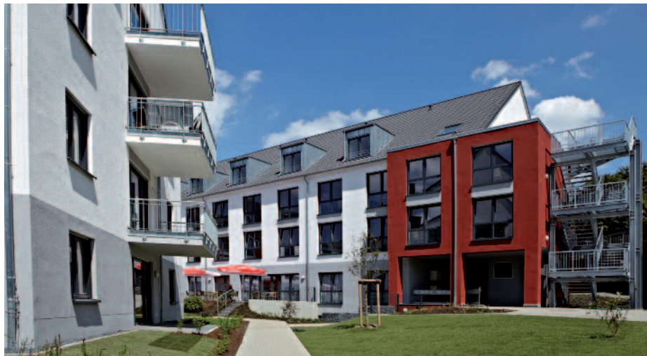
Im Senioren-Park Carpe diem kommen hochwertige Funktionstüren von Prüm zum Einsatz.

Ein sicheres, geborgenes und unkompliziertes Umfeld ist für die meisten älteren Menschen die Voraussetzung für würdevolles Altern. Nicht wenige entscheiden sich daher dafür, ihren Lebensabend unter Menschen gleichen Alters, mit ähnlichen Wünschen und Bedürfnissen zu verbringen. Der Senioren-Park Carpe diem in Bensberg in Bergisch Gladbach bietet seinen Bewohnern neben dem sozialen Miteinander auch einen Pflegeplatz mit hohem Wohnwert und Funktionalität. In puncto Zuverlässigkeit und Anspruch der Innentüren setzte die zuständige Baugesellschaft auf die Qualitätstüren von Prüm-Türenwerk, Weinsheim/Eifel