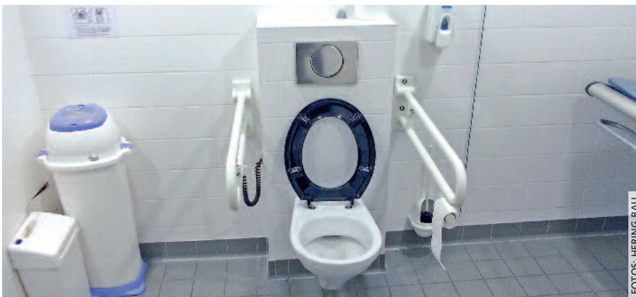
Das eigentliche „stille Örtchen“ ist auf Schwerstbehinderte ausgelegt.

Die Frage nach den Kosten müsste Technikern oder Baufachleuten gestellt werden. Klar ist jedoch, dass eine solche Anlage natürlich teurer ist als eine herkömmliche freistehende WC-Anlage, schon allein wegen des größeren Platzbedarfs und der Technik. Klar ist aber auch, dass Inklusion nicht zum „Nulltarif“ zu haben ist. Wir haben uns in Fellbach ausdrücklich zum Ziel Inklusion bekannt und einen Aktionsplan Inklusion für die Stadt erarbeitet. Natürlich werden wir zur Umsetzung auch Geld in die Hand nehmen müssen. Es gibt für Kommunen sicherlich verschiedene Möglichkeiten, solche Toiletten für alle zu realisieren. Jede Kommune muss für sich den sinnvollen Weg wählen. Ein Betreibermodell scheint mir schon deshalb überlegenswert, weil es sich um komplexe technische Anlagen handelt, deren Betrieb ein gewisses Know-how voraussetzt.