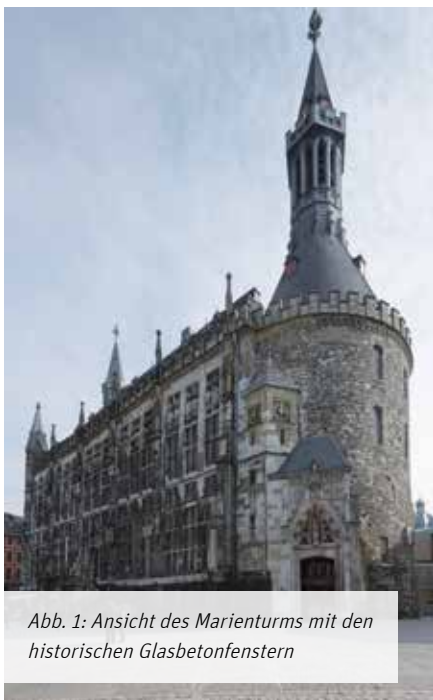
Abb. 1: Ansicht des Marienturms mit den historischen Glasbetonfenstern

Vor der Herstellung der neuen Fenster, die nach dem gleichen Prinzip wie schon vor 60 Jahren erfolgte, fand eine ausführliche Dokumentation der Fenster statt, um das Erscheinungsbild bei der Sanierung wiederherstellen zu können. So konnte die ursprüngliche Lage der etwa 15.000 Glasdallen sichergestellt werden. Da-