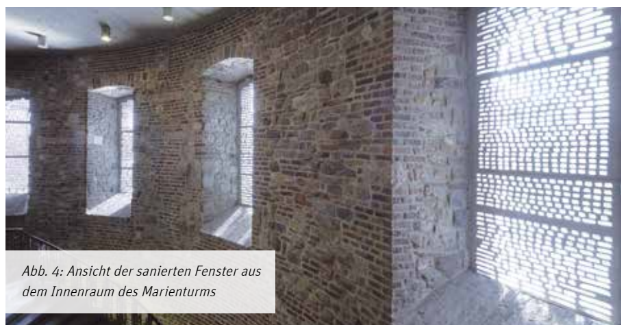
Abb. 4: Ansicht der sanierten Fenster aus dem Innenraum des Marienturms