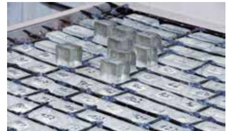
Abb. 3: Ansicht der Fenster vor der Betonage mit Carbonbewehrung

Bei den Tragfähigkeitsuntersuchungen zeigte sich, dass die Glasdallen für den Gebrauchszustand maßgebend sind. In realitätsnahen Versuchen versagte das Glas infolge Druckspannungen, bevor ein Riss im Beton auftrat. Nach dem Versagen des Glases stellte sich